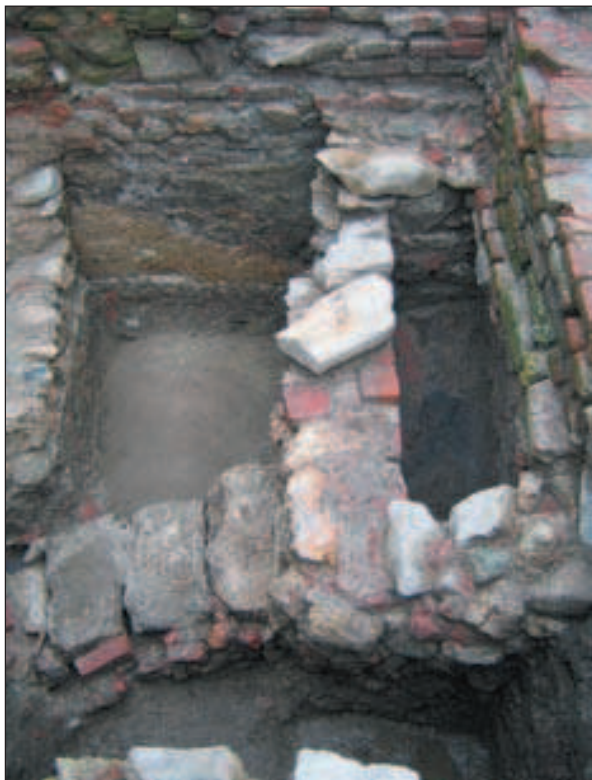
Zagreb, Vranicanijeva poljana, dio odvodnog sustava sa zidanom akumulacijom za vodu