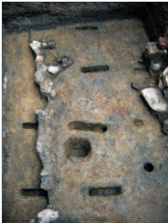
Zagreb, Vranicanijeva poljana, ukopi za nosivu konstrukciju daščanog poda

Mašić; konzervatorski nadzor: Gradski zavod za zaštitu spomenika kulture i prirode u Zagrebu; novčana sredstva za istraživanja osigurao je Grad Zagreb). Riječ je o prostoru na Gornjemu gradu, omeđenu kulom Lotrščak na istoku, zgradom Državnoga hidrometeorološkog zavoda na zapadu, gradskim srednjovjekovnim bedemom na jugu, te Vranicanijevom, nekada Sjemenišnom ulicom, na sjeveru.